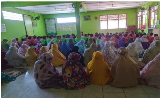
Gambar 2. Nilai Religius

ketahui pelaksanaan sholat berjamaah yang dilakukan setiap waktu dzuhur . ketika memasuki waktu ibadah peserta didik menuju ke mushola dan mengumandangkan azan. Hal ini dilakukan peserta didik dalam melaksanakan kewajibanya bagi agama yang di anutnya.