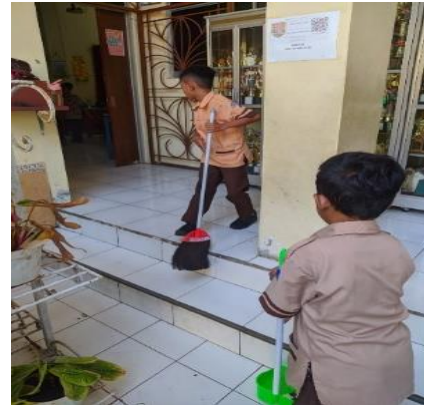
Gambar 3. Jum'at Bersih

Nilai peduli lingkungan adalah sikap atau tindakan yang berupaya mencegah kerusakan lingkungan dengan menjaga dan melestarikan lingkungan di sekitar tempat tinggalnya. Seperti halnya peserta didik kelas 4 SDN Bugangan 03. Setiap hari jumat melakukan gotong royong dalam peduli lingkungan atau yang sering di sebut Jum'at bersih.