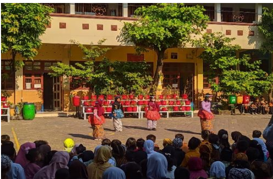
Gambar 5. Nilai Kreatifitas

Candra,wahyu (2020:17) Mengemukakan kreatif merupakan ketrampilan Berpikir dan melakukan sesuatu dalam menghasilkan cara atau hasil yang baru dari ide yang muncul pada diri individu. Setiap hari kamis SDN bugangan 03 melaksanakan kegiatan P5, dimana peserta didik menampilkan sebuah pentas seperti pentas seni tari, rebana, dan bermain peran. Selain itu peserta didik juga kreatif dalam memanfaatkan barang bekas seperti pemanfaatan botol menjadi pot bunga, tempat pensil dan lain-lain. Kreatif inilah yang bisa membangun ketrampilan peserta didik dalam mengembangkan bakatnya