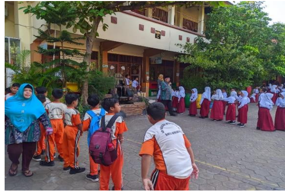
Gambar 4. Nilai Disiplin

Nilai disiplin merupakan nilai penting dalam kehidupan. Sebagai individu sangat perlu menerapkan kedisiplinan karena dengan itu kita bisa mengatur dan memajemen suatu pekerjaan dengan baik. Salah satu yang nampak dari peserta didik di kelas 4 SDN Bugangan yakni pengimplementasian nilai disiplin yang dilakukan setiap harinya pada saat berangkat sekolah. peserta didik masuk kelas tepat pukul 07.00 WIB 15 menit sebelum memasuki kegiatan belajar mengajar. Peserta didik duduk di bangkunya masing-masing dan mempersiapkan diri mengikuti pembelajaran. Kedisiplinan ini lah yang perlu kita jaga dan kita terapkan dalam kehidupan.